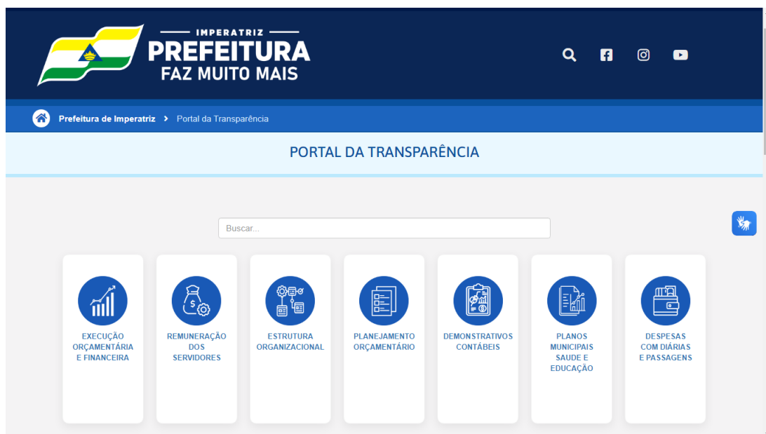
Imagem 03: Portal da Transparência da PMI – recomendação de local para posicionamento do PACP