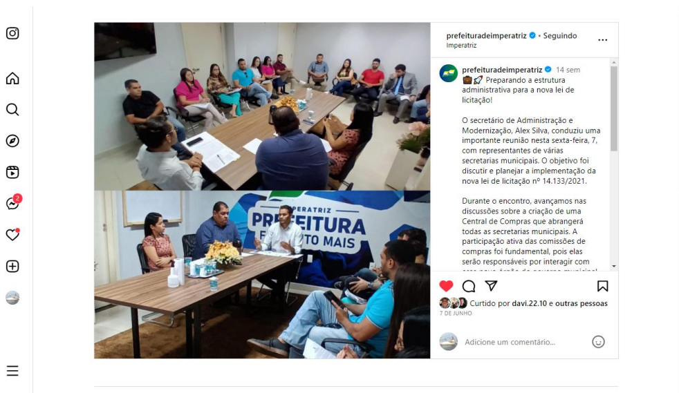
Imagem 02: Reunião de trabalho na SEAMO, dia 07 de junho de 2023.